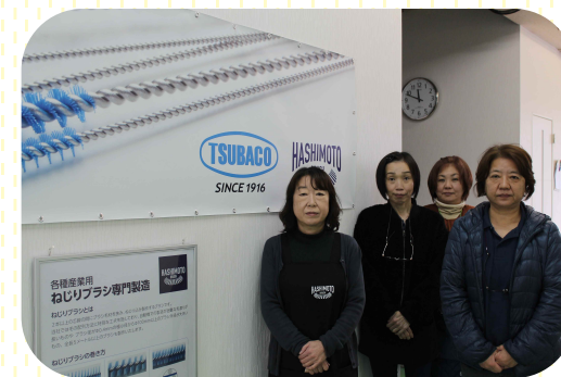
女性管理職の皆さん

この度は、令和4年度女性リーダー登用先進企業表彰にて、特別優良賞授与の栄誉を賜りまして誠にありがとうございます。これを契機に、一層の女性の活躍や登用を推進して参りたいと考えております。今後とも、従業員一同が共に生きがいを持って働ける職場環境づくりに邁進してまいります。そして、我が社が世界一のブラシ製作所として確固たる地位を確立し、社会や本県経済の振興に貢献できるよう取り組んでまいります。